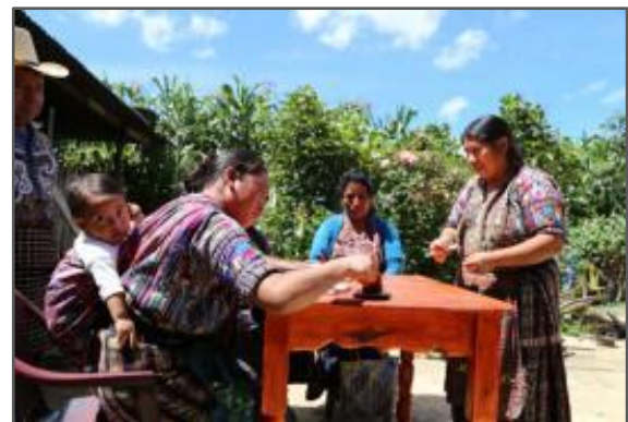
Fotografía 4: Comité responsable de administración, operación y mantenimiento del sistema de AP y S, Sector La cumbre, Chuimanzana, El Tablón, Sololá en proceso de rendición de cuentas