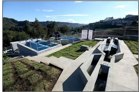
Fotografía 2: Planta de tratamiento de Aguas Residuales, San José Chacaya (Pretratamiento y reactores UASB)