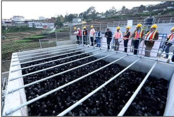
Fotografía 1: Planta de Tratamiento de Aguas Residuales, San José Chacaya (Lechos bacterianos).