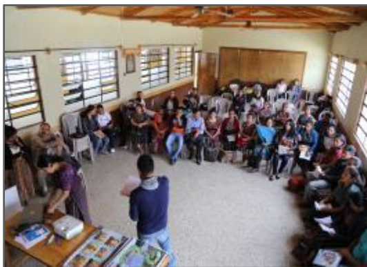
Fotografía 3: Fortalecimiento de capacidades a docentes en temas relacionados a educación hidrosanitaria, manipulación de alimentos y cuidado del recurso hídrico.