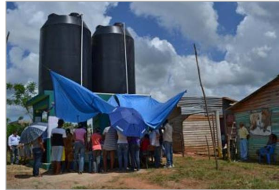
Fotografía 4: Inauguración de las obras, Provincia de Monte Plata, septiembre del 2013