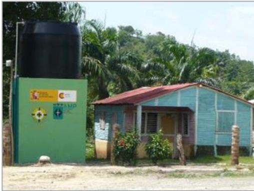
Fotografía 3: Reservorio de agua, Comunidad Camarones, Monte Plata