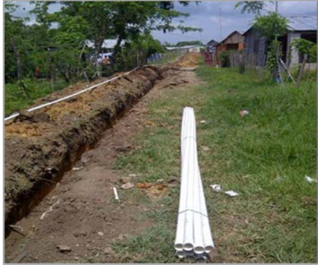
Fotografía 1: Acueducto de agua, Comunidad La Ceja Monte Plata