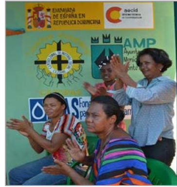
Fotografía 2: Inauguración de las obras, Provincia de Monte Plata, septiembre del 2013