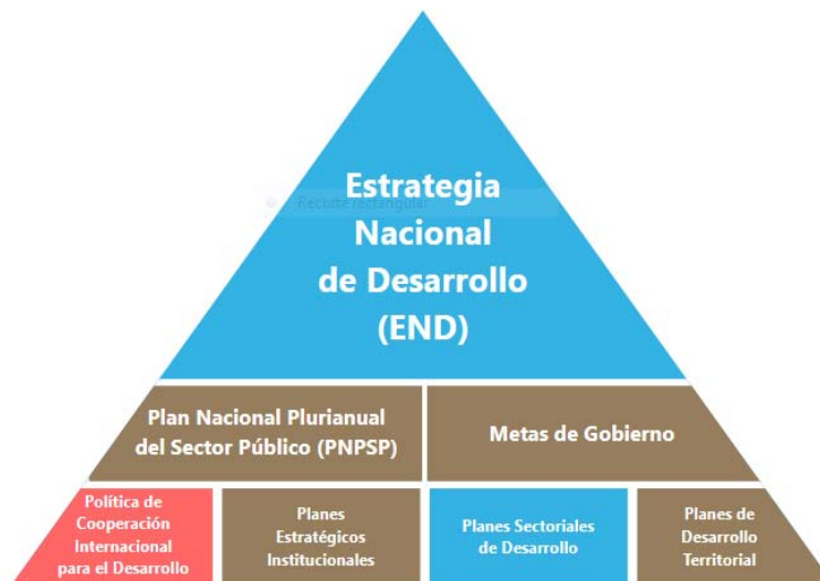
Figura 1. Sistema de Planificación del país