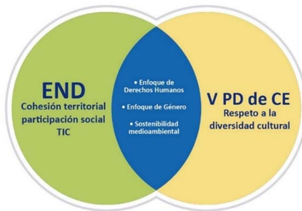
Figura 3. Principios transversales de la END versus Principios transversales V PD CE